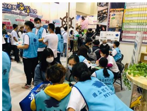
照片說明：與學生介紹學校及學系