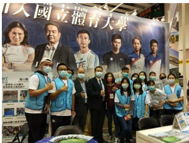
照片說明：本校團隊合影留念