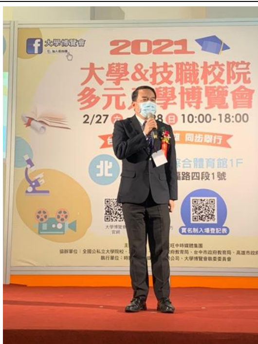
照片說明：校長致詞