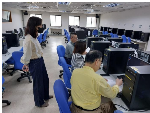
照片說明：產經系教師操作系統