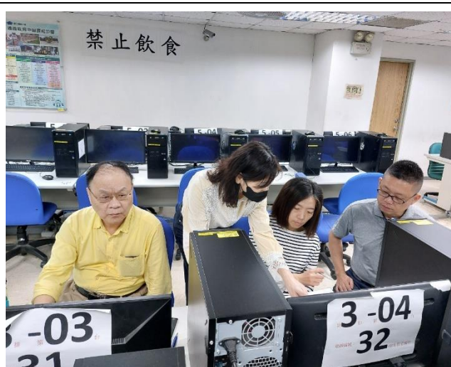
照片說明：組長向師長說明