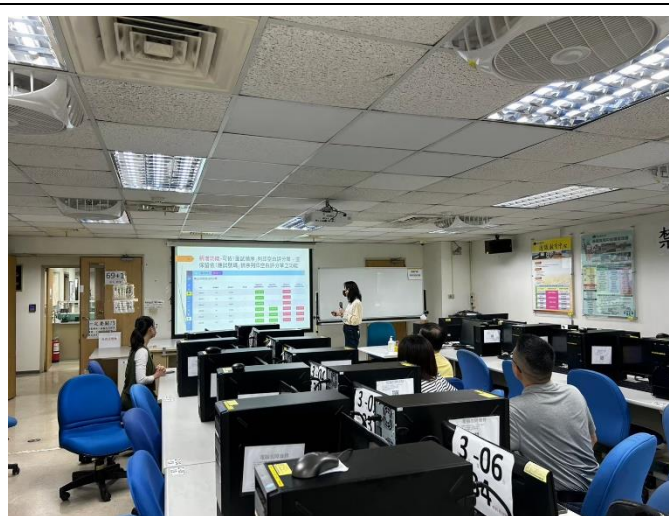
照片說明：整體流程說明