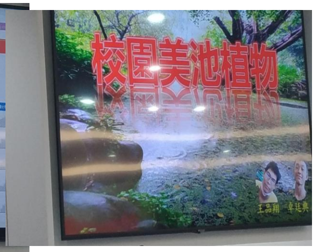
圖片說明：學生自主學習成果主題