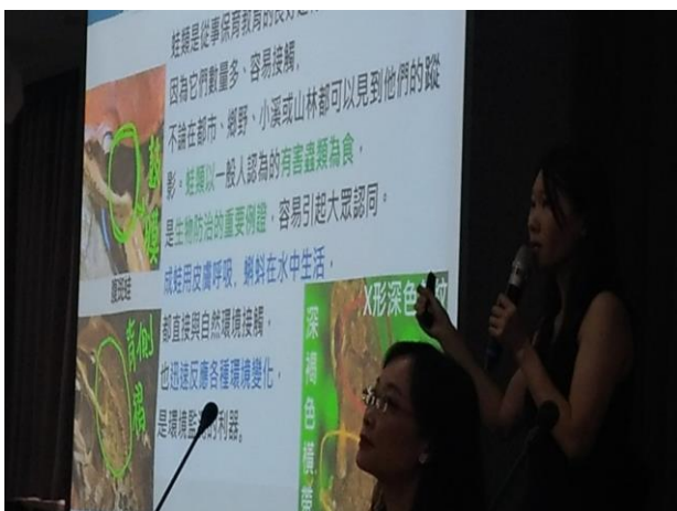
圖片說明：學生自主學習成果說明