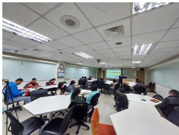
照片說明：參與情形