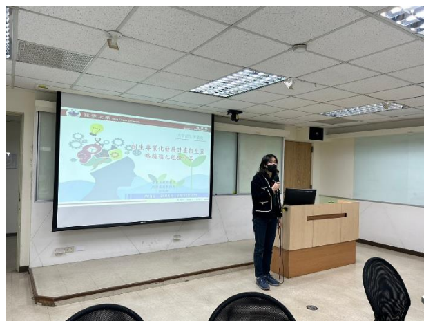
照片說明：組長開場致詞