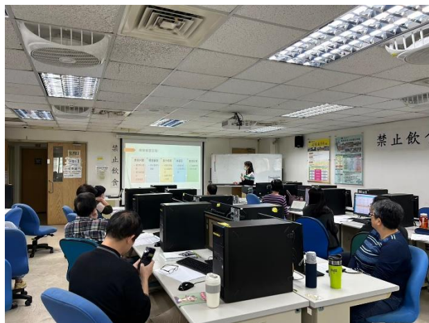
照片說明 整體流程說明