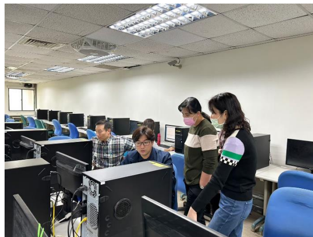
照片說明：組長向師長說明