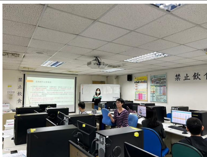
照片說明：運保系主任說明注意事項