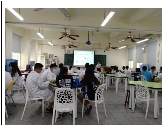
照片說明：下週授課說明