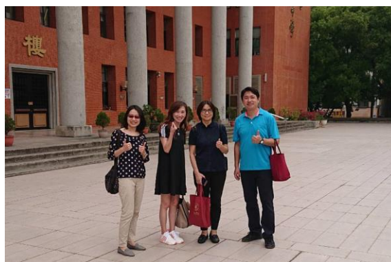
照片說明：與授課教師合照