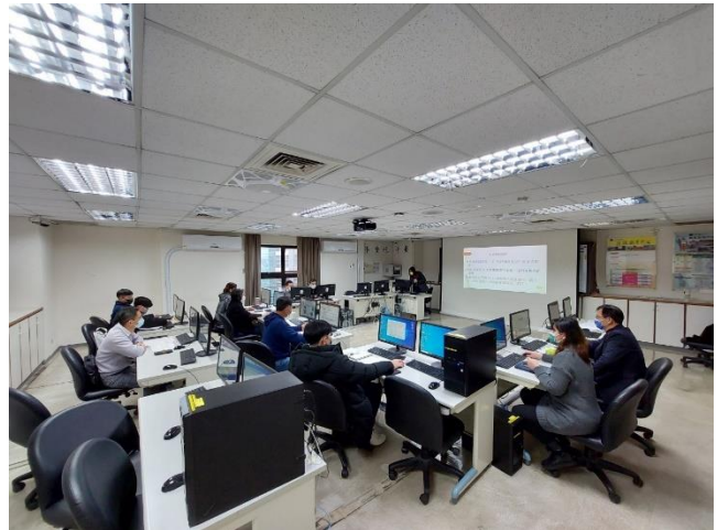
照片說明：參與情形