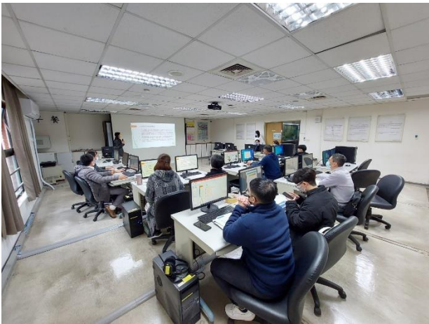
照片說明：組長說明書審係操作注意事項