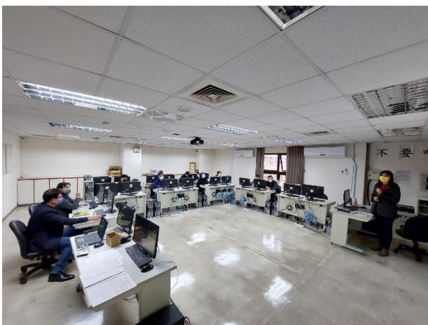
照片說明：參與情形