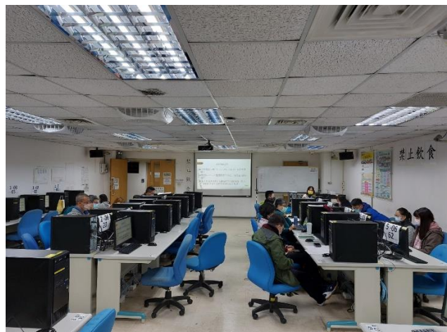
照片說明：參與情形