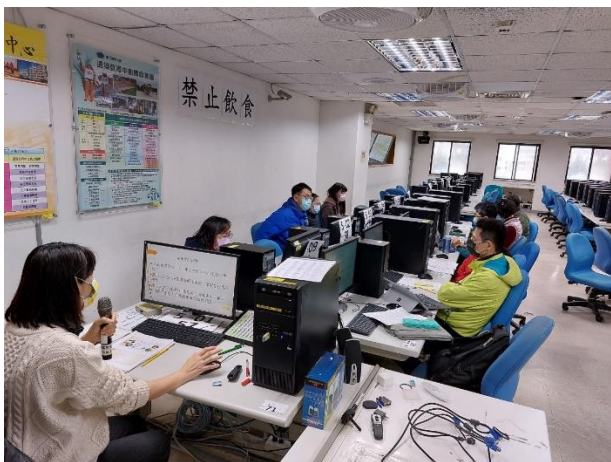
照片說明：組長說明書審係操作注意事項