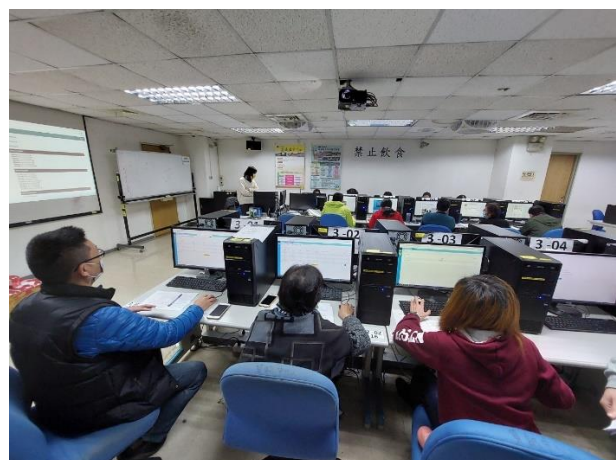
照片說明：系上師長討論情形