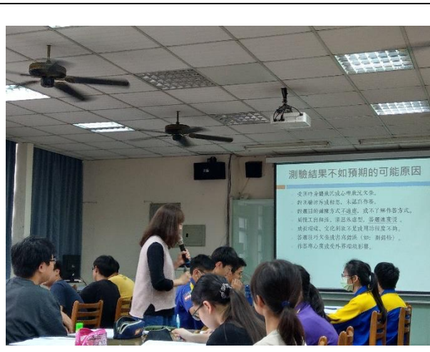
照片說明：互動問答及引導思考