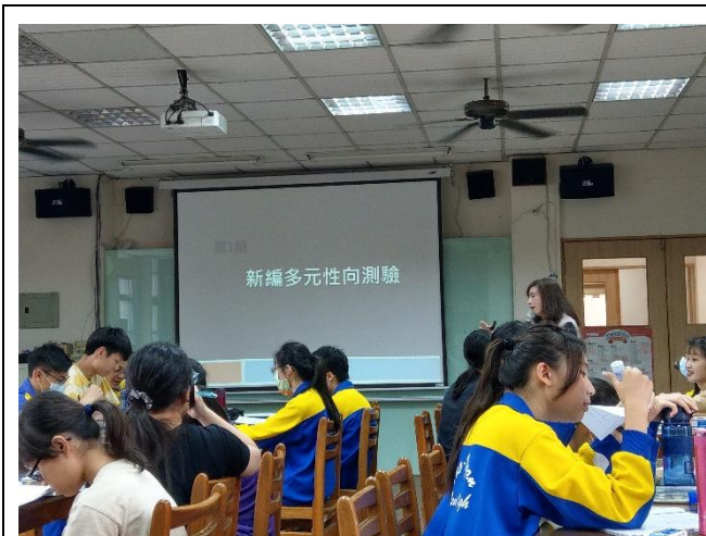
照片說明：說明測驗及結果解釋