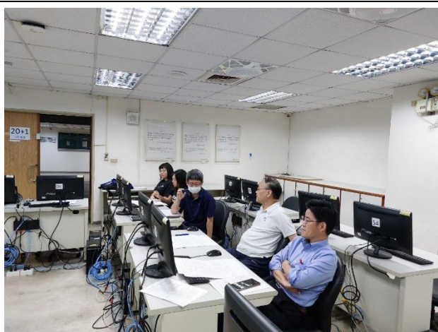
照片說明：師長進行差分檢核及討論