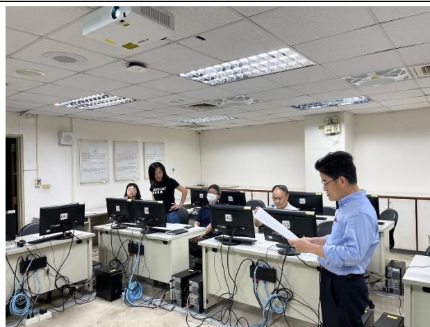
照片說明：師長進行差分檢核及討論