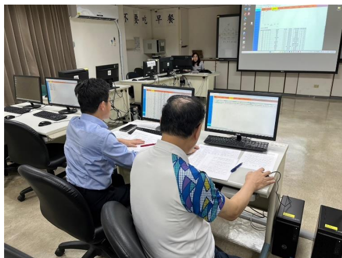
照片說明：師長進行模擬審查