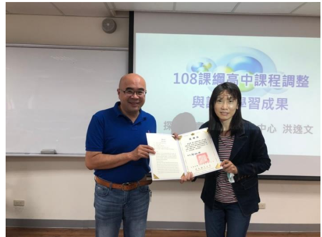
照片說明：組長頒發感謝狀