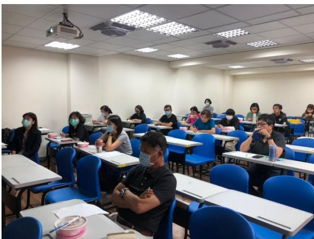
照片說明：與會人員