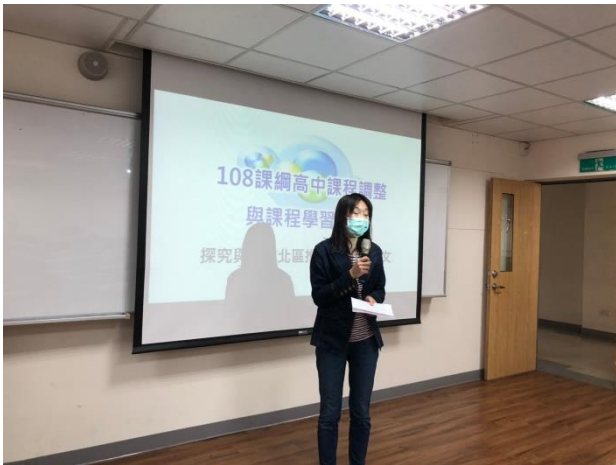
照片說明：主持人介紹講者