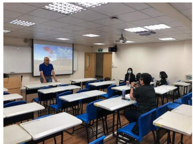
照片說明：提問及意見交流