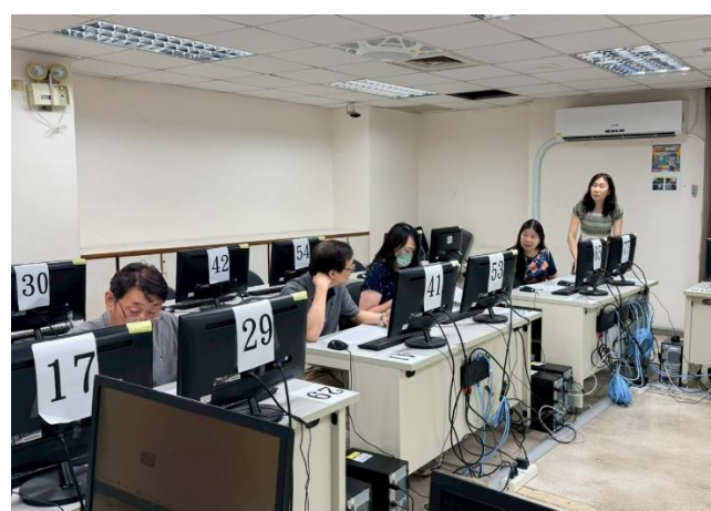
照片說明：師長進行差分檢核及討論