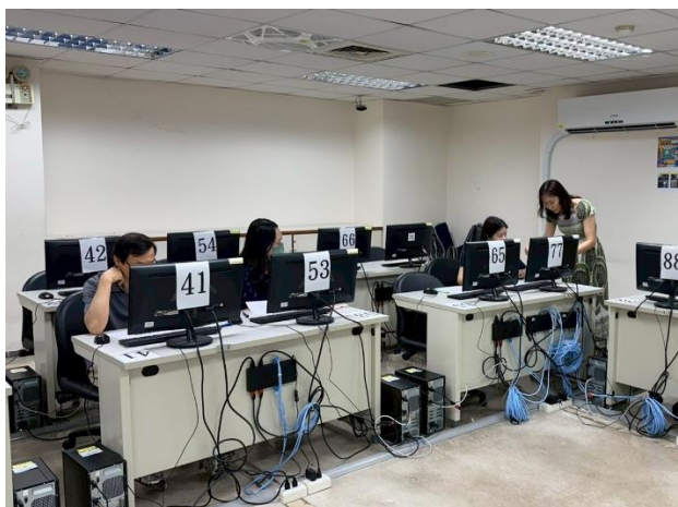
照片說明：師長進行模擬審查