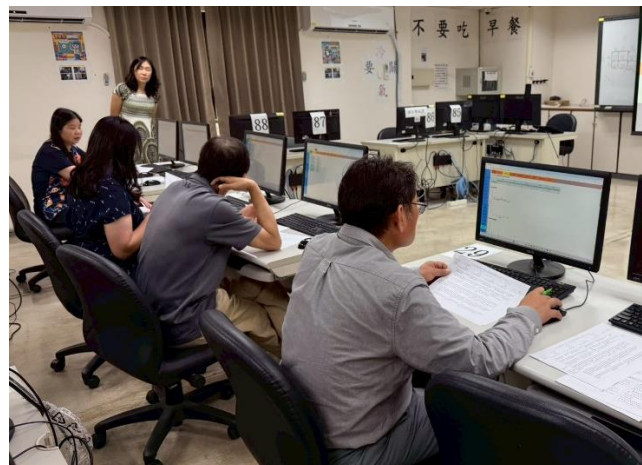
照片說明：師長進行模擬審查