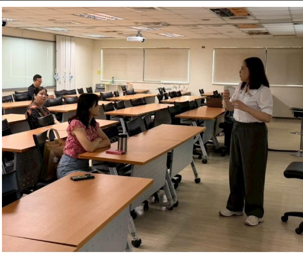
照片說明：互動情形