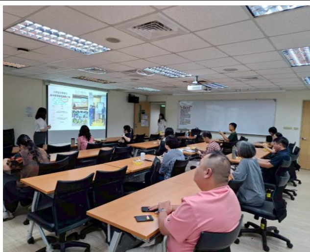
照片說明：參與情形