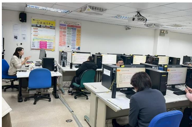
照片說明：整體流程說明