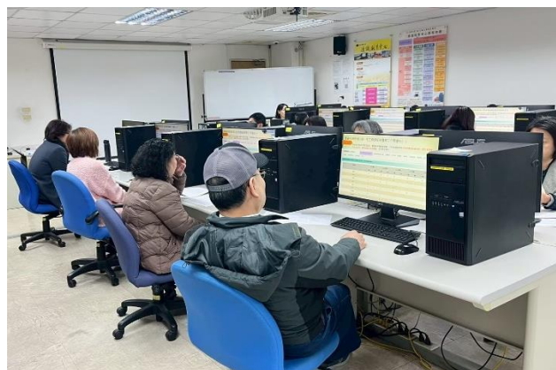
照片說明：活動參與情形