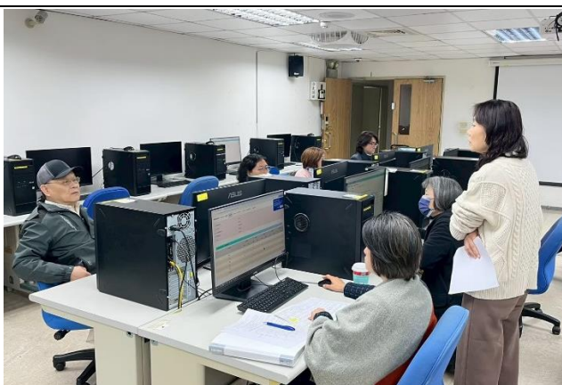
照片說明：師長討論情形