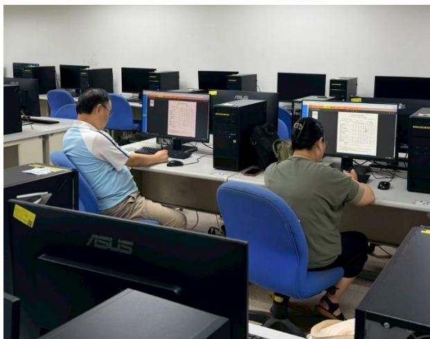
照片說明：師長進行模擬審查