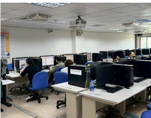
照片說明：師長進行模擬審查