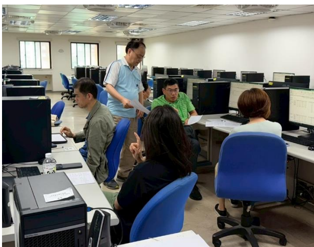
照片說明：師長進行差分檢核及討論