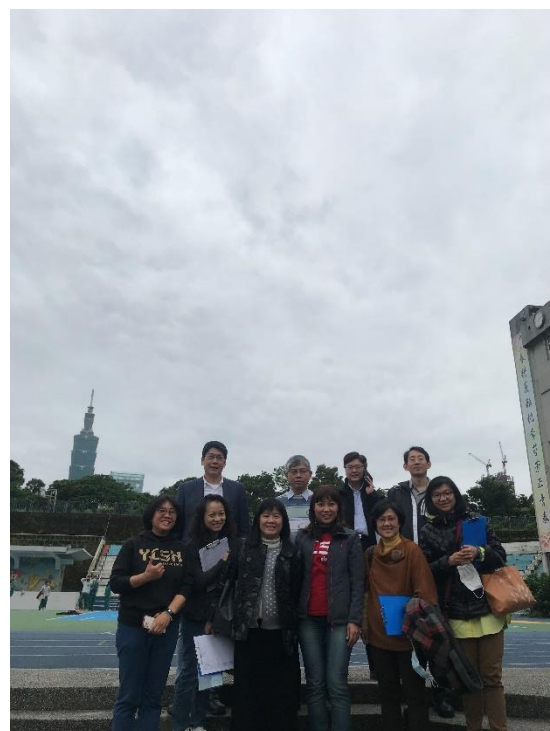
照片說明：永春高中校長、主任與其他大學端觀課老師們合影