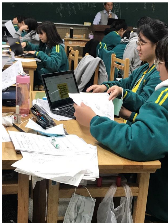
照片說明：學生課堂討論。