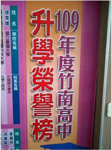
109年度升學榮譽榜單