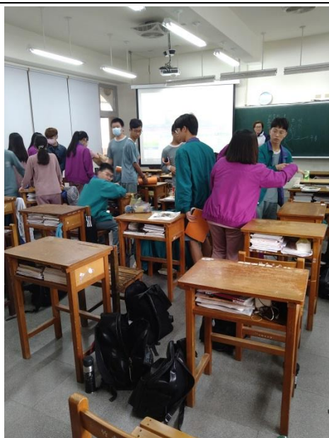
照片說明：小組各自佈置桌椅